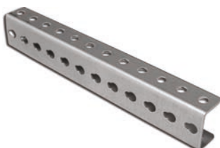
Подвесная скоба ТВ