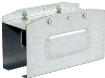
Соединительный элемент КТ