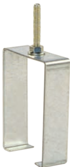
Скользящая подвеска КТ