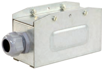
Питающий элемент КТ