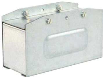
Торцевая крышка КТ